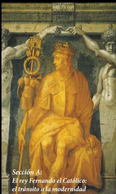
Sección A: El rey Fernando el Católico: el tránsito a la modernidad