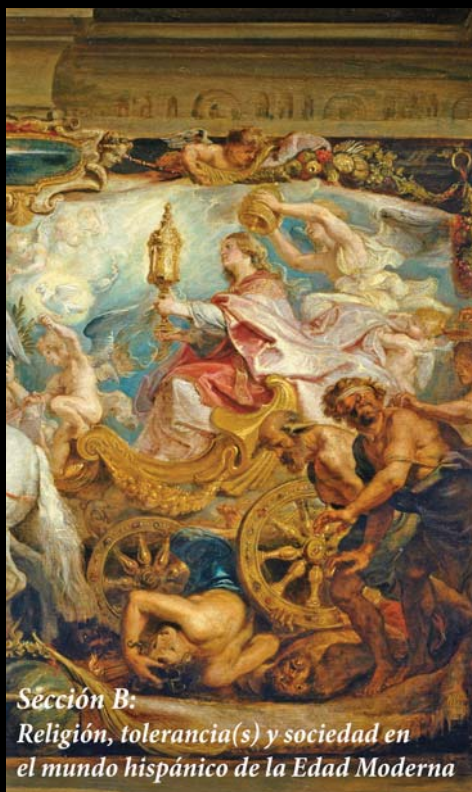
Sección B: Religión, tolerancia(s) y sociedad en el mundo hispánico de la Edad Moderna